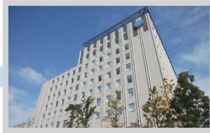
日本医科大学付属病院「特定機能病院」