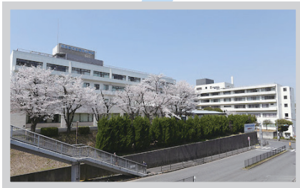
日本医科大学多摩永山病院