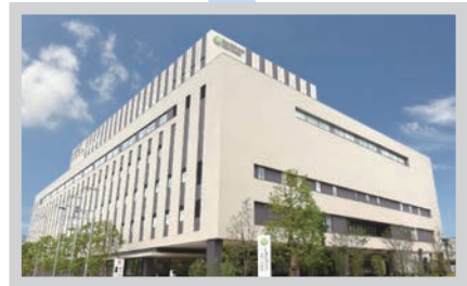
日本医科大学武蔵小杉病院