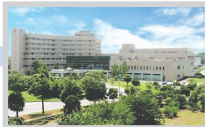
日本医科大学千葉北総病院