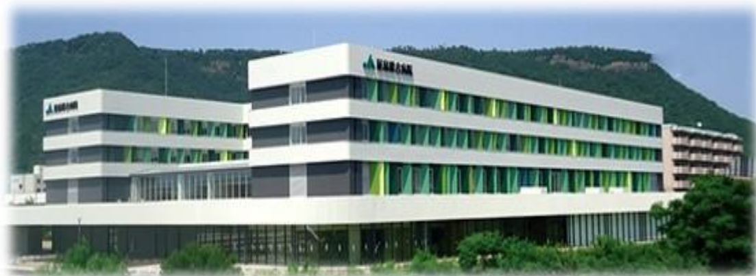
新築移転病院 2016年11月診療開始