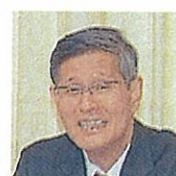
認定NPO全世代代表理事 尾身茂

医師不足で悩む地域であなたのキャリアを生かした第二の人生を歩みませんか。各様の応募をお待ちしております。